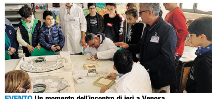
EVENTO Un momento dell'incontro di ieri a Venosa

Open day dai Padri trinitari accoglienza e riabilitazione